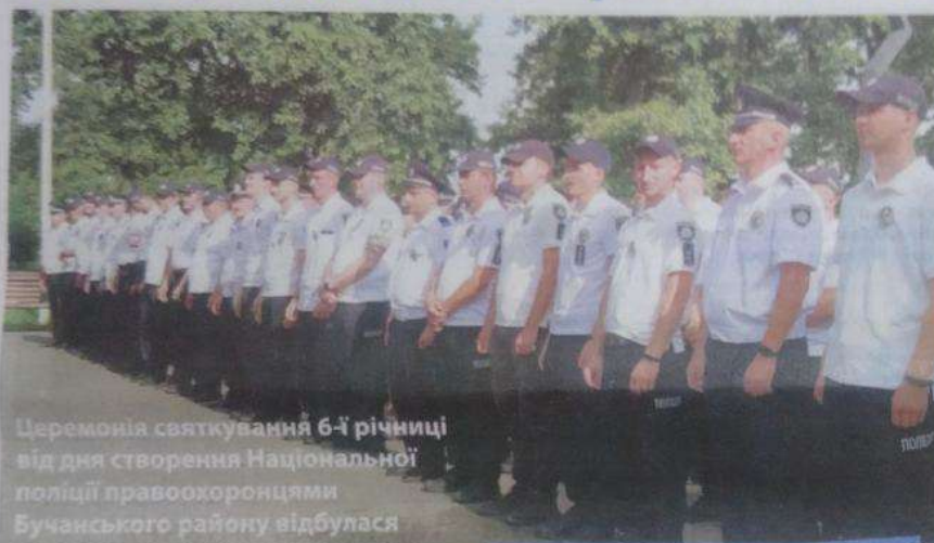
Церемонія святкування 6-ї річниці від дня створення Національної поліції правоохоронцями Бучанського району відбулася у Бучанському міському парку.

Привітати і подякувати за гідну службу українському народові приїжджали керівництво Бучанської районної адміністрації, представники Бучанської міської ради, а також інших територіальних громад Київщини.